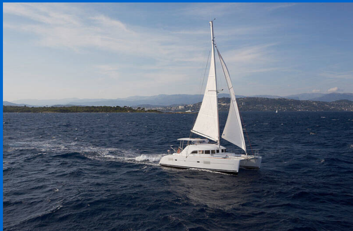
Lagoon 380 - Mention obligatoire/Mandatory credit: © photo - Nicolas Claris

Katamarán Lagoon 380 EPSILON, rok spuštění na vodu 2018 kotví v marině Šibenik – Marina Zaton, Šibenický region (Chorvatsko), Chorvatsko. Počet kajut: 4 , může ubytovat celkem: 8 + 2 a má toalet: 2 . Povlečení a kuchyňské vybavení jsou zahrnuty v ceně.