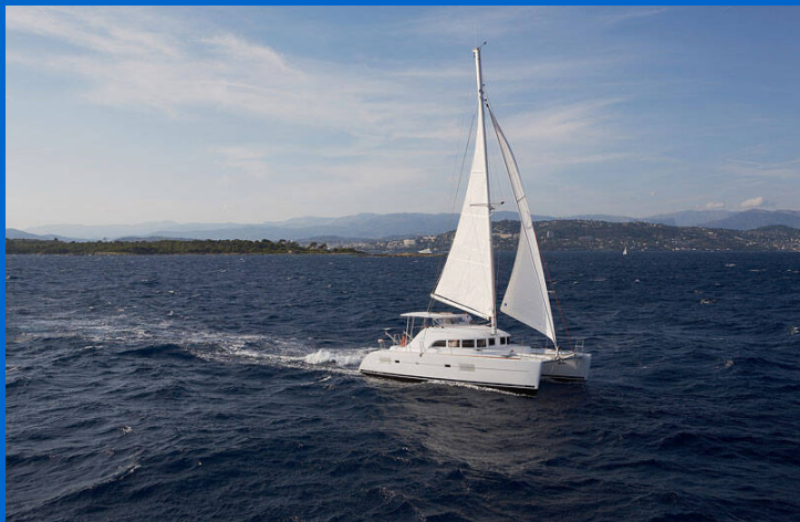
Lagoon 380

Katamarán Lagoon 380 WHITE PEARL, rok spuštění na vodu 2019 kotví v marině Trogir, Yachtclub Seget (Marina Baotic), Splitský region (Chorvatsko), Chorvatsko. Počet kajut: 4, může ubytovat celkem: 8 + 2 a má toalet: 2. Povlečení a kuchyňské vybavení jsou zahrnuty v ceně.